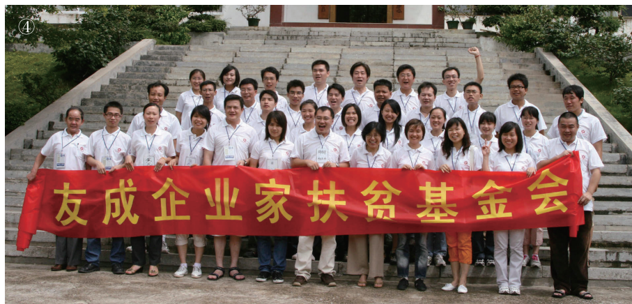
④ 友成志愿者，联合起来！