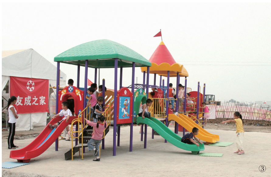
③ 小朋友在“友成之家”提供娱乐设施上恢复了孩子的天性