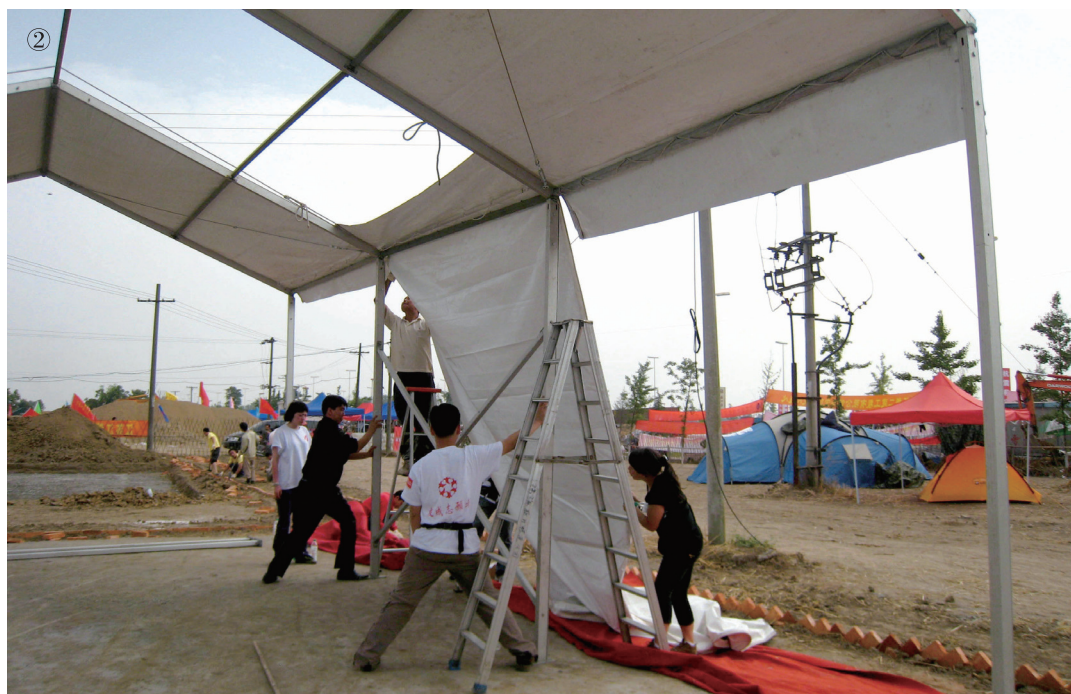
② 友成志愿者奋力搭建“友成之家”儿童活动中心